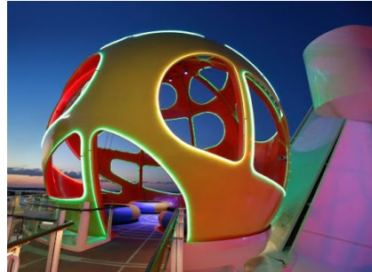
南極球 Skypad *新登場