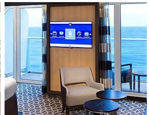
標準套房 Junior Suite