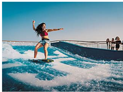
甲板衝浪®+甲板跳傘