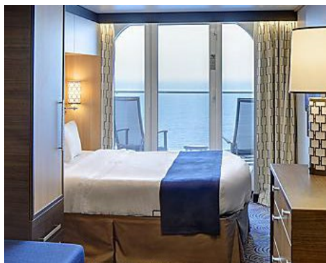
海景露台房 Oceanview Balcony