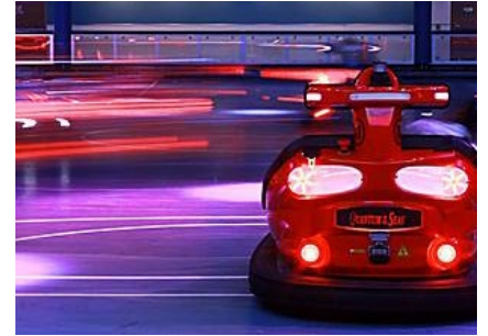
海上多功能運動場 (SEAPLEX®)