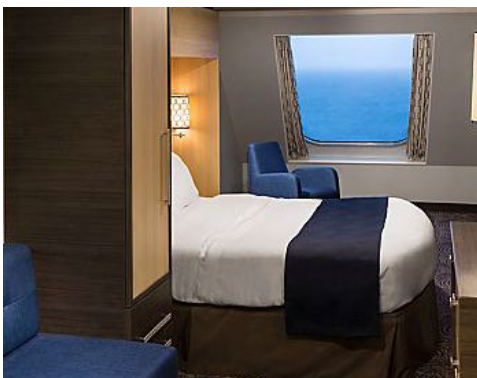
海景房 Oceanview Stateroom